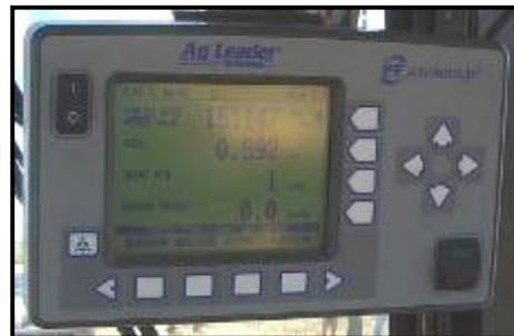
Fig 5: Monitor D&E nacional (izquierda) y monitor Ag Leader importado (derecha).