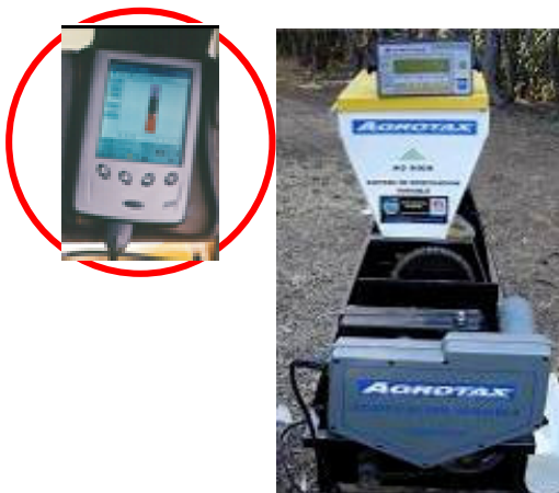
Fig. 6: Equipamiento mecánico para aplicación de dosis variable de fertilizante. Puede aplicar en tiempo real mediante una prescripción realizada en una computadora palm top más un programa de agricultura de precisión (Farm Site).