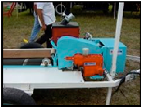
Fig. 7: Equipamiento de la empresa Dirocco. Sistema hidráulico bomba de caudal y presión variable, no produce calentamiento. Es variable por accionamiento manual.