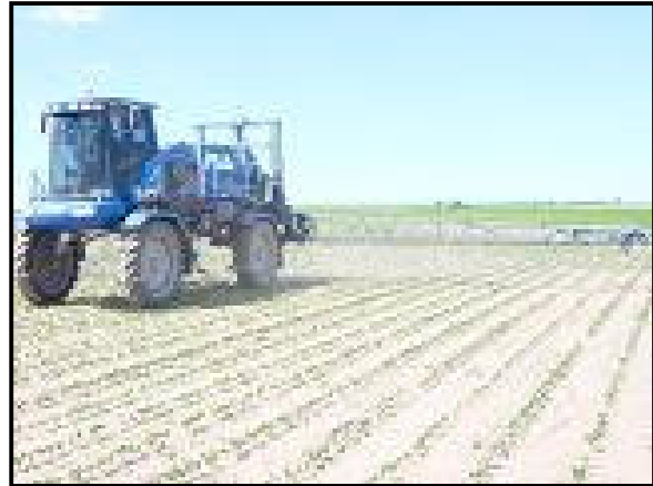
Fig. 9: Equipamiento disponible en pulverizadoras para realizar dosis variable de fertilizantes líquidos chorreados en tiempo real por medio de una recomendación más GPS o en forma manual. En tiempo real más recomendación la opción podría ser una palm top con software de dosis variable o monitores específicos que son navegadores. Pulverizadora equipada para pulverizar y fertilizar al mismo tiempo (2 tanques, 2 botalones v 2 computadoras).

Como conclusión se puede decir que el productor argentino dispone de casi todos los desarrollos mecánicos y electrónicos / inteligentes disponibles a nivel mundial en materia de técnicas de aplicación de fertilizantes sólidos o líquidos.