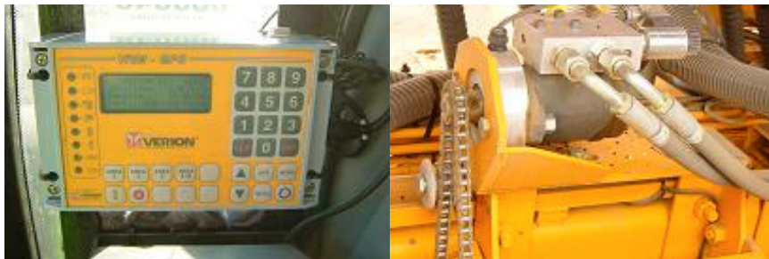
Fig. 2: Monitor Verion para dosis variable manual o satelital.

Para ello se pueden utilizar diferentes software que puedan leer archivos Excel, Shape File o similares de puntos o de áreas los cuales al estar georeferenciados (latitud y longitud) pueden realizar los cambios de dosis y densidad correspondientes. Luego esa información se ingresa a los monitores navegadores que son los que leen la prescripción y transmiten esa lectura a los controladores que son los que van hacer que los actuadores produzcan los cambios de vueltas para así dosificar más o menos insumos según lo que necesite el sitio del lote.